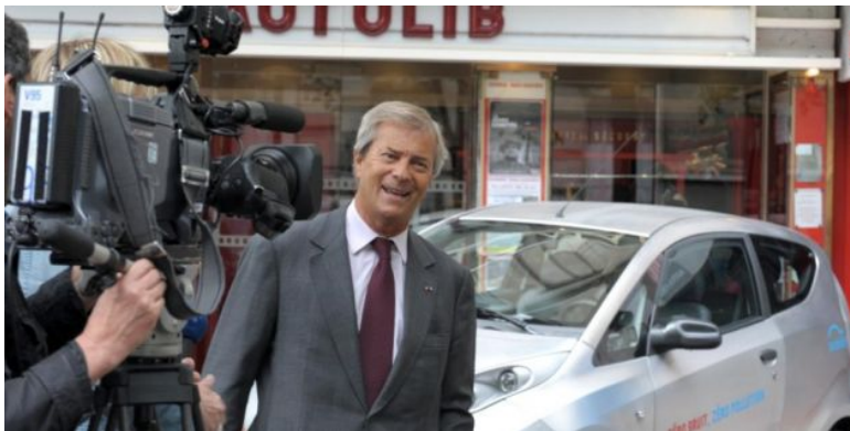
PHOTO CI-DESSUS Vincent Bolloré, PDG du groupe Bolloré qui a lancé le réseau de voitures électriques en libre-service à Paris et en Ile-de-France.