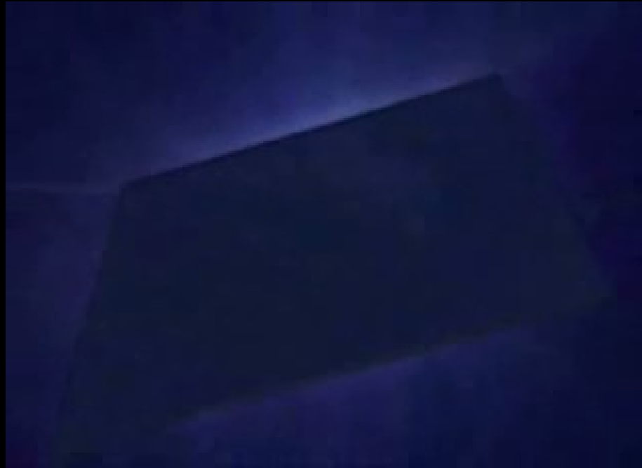
Lancers de canettes